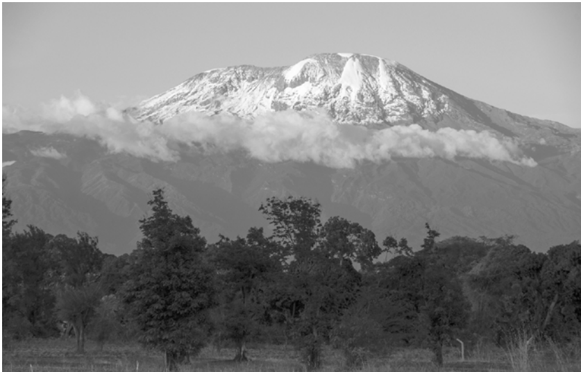
Am Kilimand- scharo

Ursprünglich waren ja nur fünf Jahre geplant. Aber wir fühlten uns sofort wie zuhause. Und so gut aufgenommen sind wir dann länger geblieben. Auf einmal sind die sieben Jahre rum. Dafür sind wir der Gemeinde sehr dankbar. Es ging ja nicht nur um das Arbeiten, sondern auch um das Lernen. Was wir hier gelernt haben, wird uns weiter begleiten – im Alltag und in unserem Dienst für die Kirche. Für alle Unterstützung sowie die gewonnenen Freunde und Nachbarn bedanken wir uns sehr.