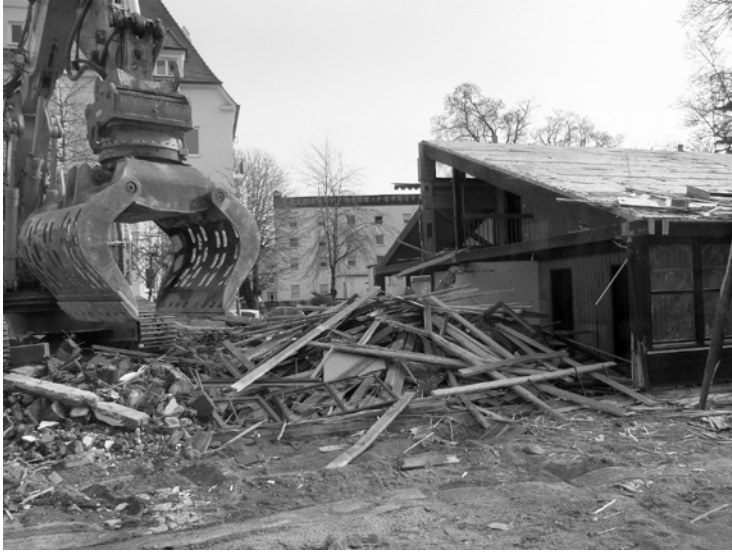
Das war er – der Kindergarten

Seit 4 Monaten finden nun schon der Kindergartenbetrieb und das Gemeindeleben unter einem Dach statt. Für die Kinder war es am Anfang ungewohnt, ihren Kindergarten mit Erwachsenen zu teilen. Sobald sie fremde Stimmen hörten, schauten sie dann auch immer wieder aus der Gruppenraumtür oder spitzelten neugierig in den großen Saal. Ein Kind stellte dann aber enttäuscht fest: „Die sitzen ja nur rum und reden in unserem Turnraum. Ist das langweilig!“