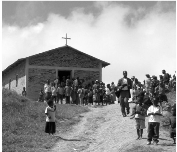
Kirche in Tansania

Wir beschäftigen uns als Familie natürlich bis jetzt mit der Frage: Und wohin? Eines ist aber sicher: Wir fliegen nach Moshi, am Kilimandscharo, 2000 Meter hoch am Berg, wo die Eltern wohnen. Da haben wir auch eine Wohnung. Arbeiten werde ich vielleicht auch dort. Zwei Pfarrstellen stehen bis jetzt im Blick, wo ich eingesetzt werden könnte. Bald wird bestätigt werden, welche Stelle ich übernehmen darf. Froh sind wir natürlich sehr, dass unsere Kirche in